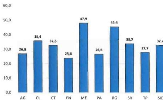
Graf. 10 - Tassi di incidenza/1000/anno (nati 2011-2016) nelle aree a rischio ambientale per i principali apparati